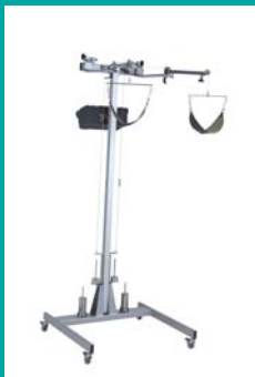
Follo Stabilis Hjelpear