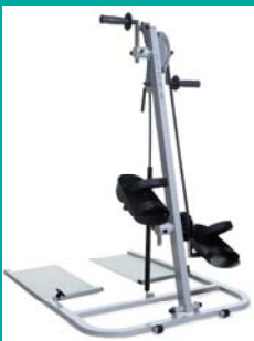
Follo Stabilis Manuped